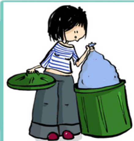
Throw out garbage Jeter les ordures رمي القمامة