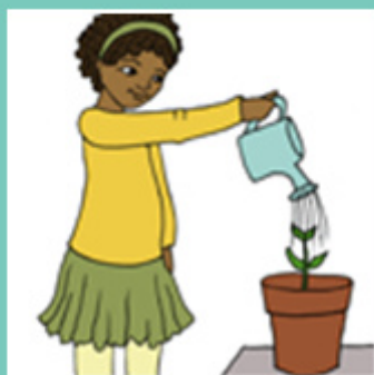
Watering plants Arroser les plantes