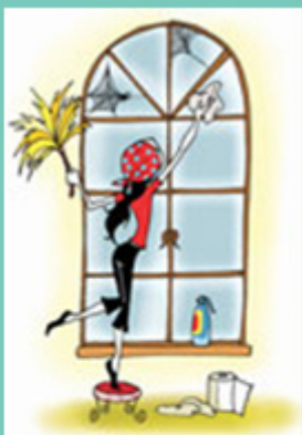
Wash windows Laver les vitres غسل زجاج النافذة