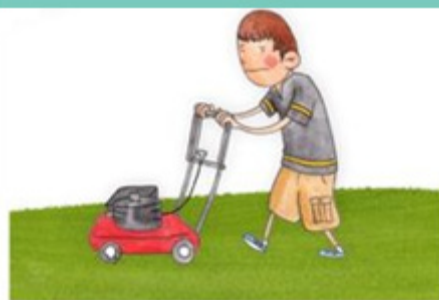
Mow lawn Tondre la pelouse