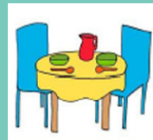
Set table for dinner Préparer la table pour le dîner